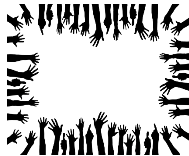
Le poème liberté de Paul Eluard illustré par Fernand Léger.