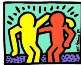
Solidarité K Haring

A partir de la représentation de mains : effectuer des assemblages, des collages, des superpositions, jouer avec les couleurs