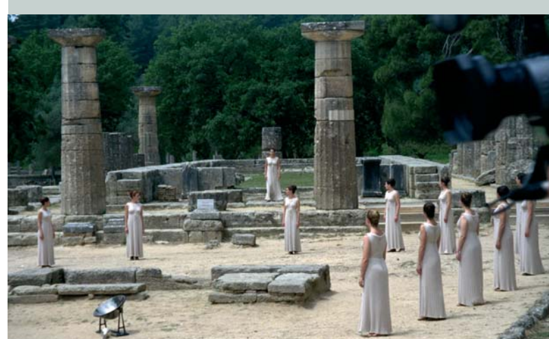
Les prêtresses dans le temple d'Héra.

Illustration: P. HANRY / DDBP par Alain & Grégoire Gellens