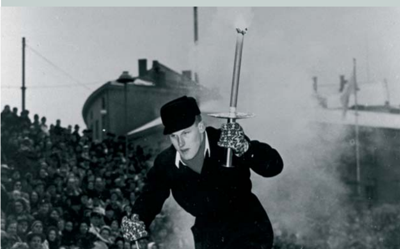
Un relayeur de la flamme des Jeux Olympiques d'hiver d'Oslo 1952 (NOR). A l'occasion de ces Jeux la flamme n'a pas été allumée à Olympie mais à Morgedal, dans le foyer de Sondre Norheim, pionnier du ski moderne.