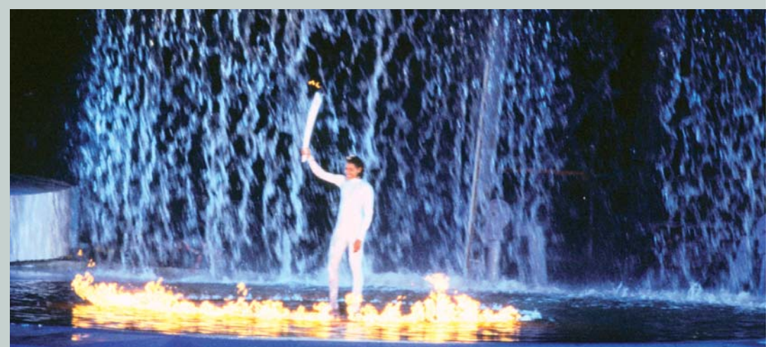
Dernière relayeuse, l'australienne Cathy Freeman, d'origine aborigène allume la vasque du stade olympique lors de la cérémonie d'ouverture des Jeux Olympiques de Sydney 2000 (AUS).