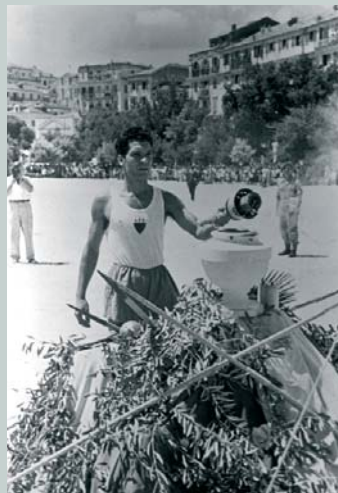
Le relais de la flamme olympique de Londres 1948 (GBR).