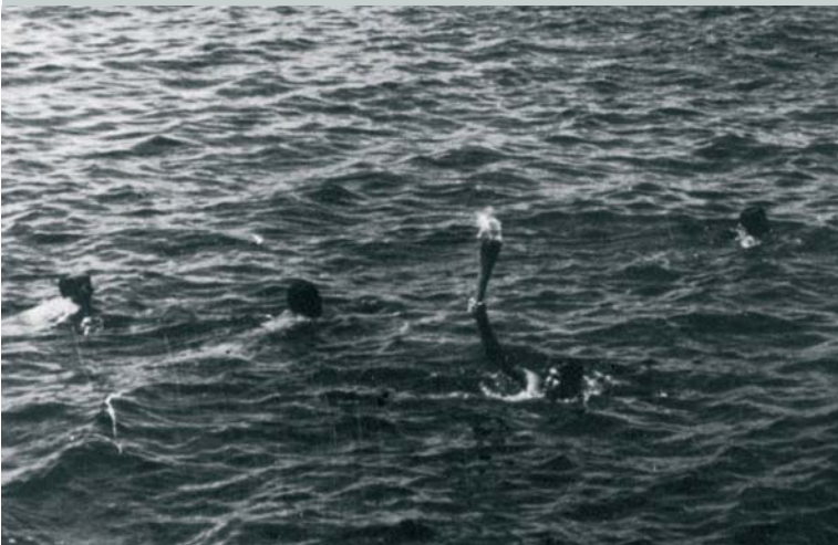
Dans l'eau, un nageur assure un relais de la flamme olympique des Jeux Olympiques de Mexico 1968 (MEX).

Illustration: F. HANRY (2007) par Buache & G. B. G. G.