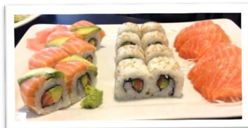
Un plat de sushis