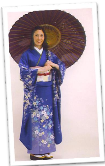
Le kimono est un vêtement traditionnel

Tokyo est la capitale du Japon, c'est la plus grande ville du monde. Le Japon est formé par de nombreuses îles. C'est un pays qui a des traditions anciennes et qui est à la pointe de la technologie.