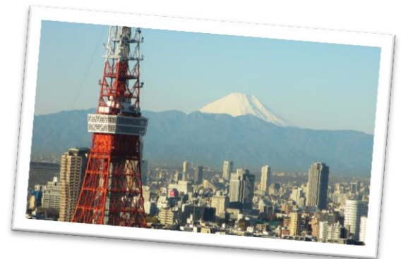
Tokyo, la tour de Tokyo, et le mont Fuji