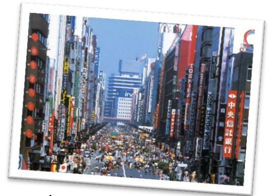
Une avenue de Tokyo