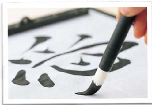
La calligraphie au pinceau

Tokyo est la capitale du Japon, c'est la plus grande ville du monde. Le Japon est formé par de nombreuses îles. C'est un pays qui a des traditions anciennes et qui est à la pointe de la technologie.